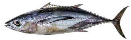
Provenance des débarquements français de Thon germon en 2023